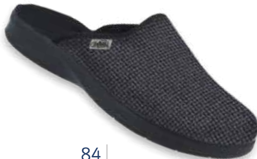
84 | 548M026 39-47 Leon