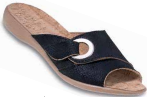
28 265D005 36-41 Viki