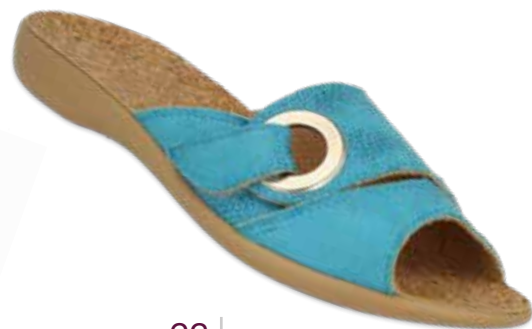
29 265D007 36-41 Viki