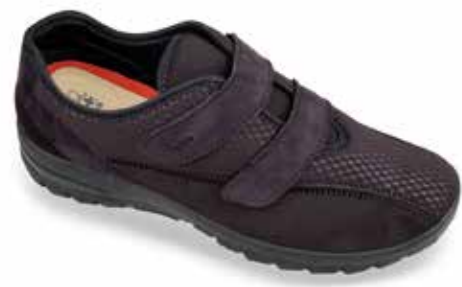
10 MODEL ROZMIAR 517D014 37-42