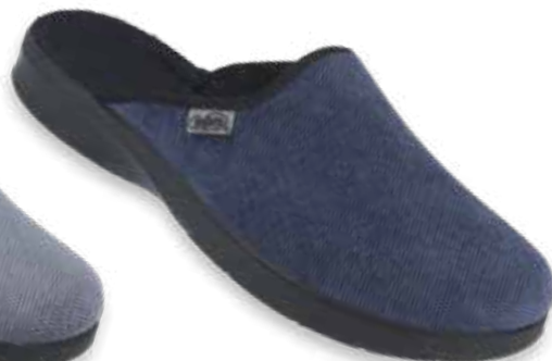
77 | 548M018 39-47 Leon