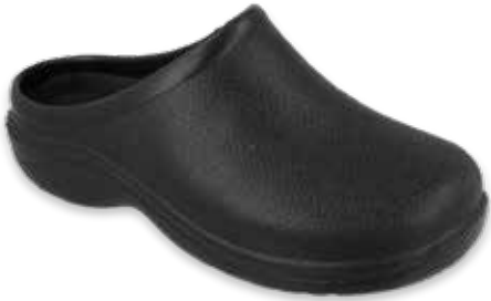
11 MODEL ROZMIAR 154D001 36-41