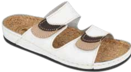
WZÓR ROZMIAR 158D172 36-41