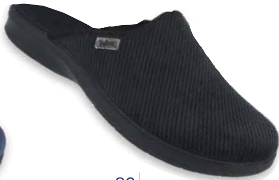
82 | 548M020 39-47 Leon