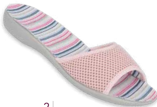
2 300D044 36-41 Viki