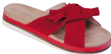
WZÓR ROZMIAR 158D154 36-41