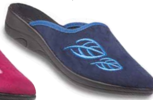
53 552D002 35-41 Jula