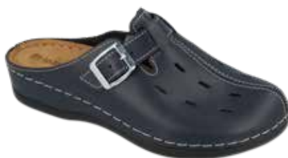
WZÓR ROZMIAR 158D159 36-41