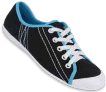
60 | 248Q019 36-39 Lena