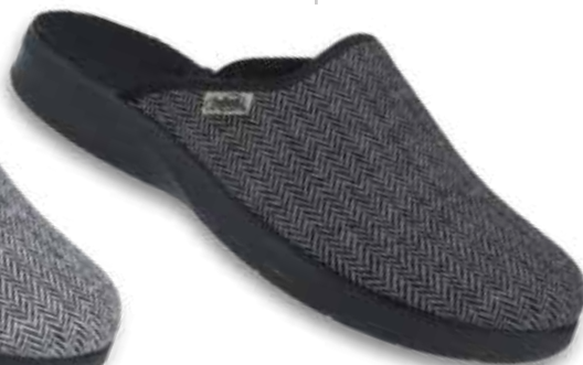
74 | 548M024 39-47 Leon