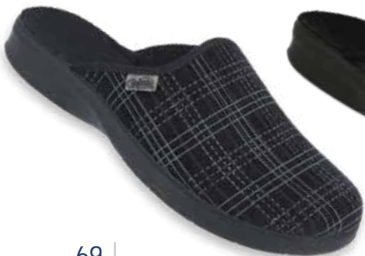
69 | 548M003 39-47 Leon