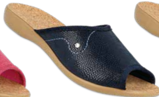
18 | 254D093 36-41 Viki