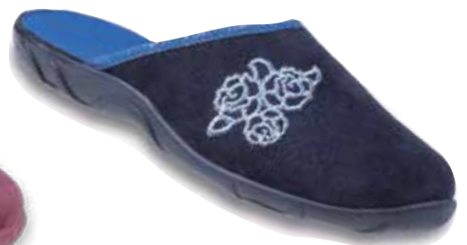
44 235D157 36-41 Paula