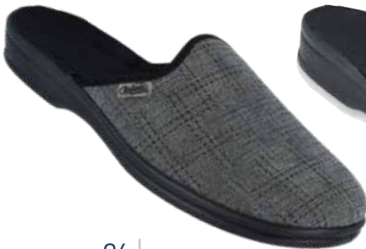
96 | 089M410 39-47 Parys