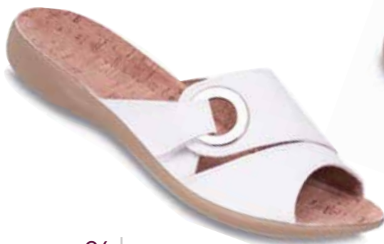
26 265D002 36-41 Viki