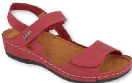
WZÓR ROZMIAR 158D100 36-41