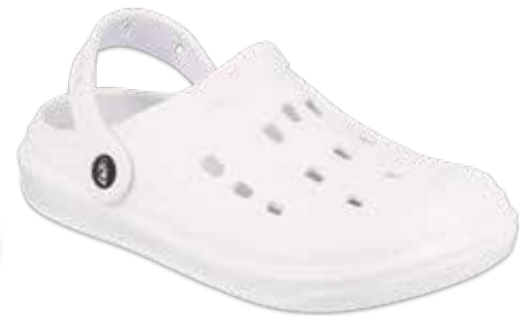
19 MODEL ROZMIAR 154M001 40-45