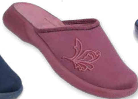
43 019D096 35-41 Olivia