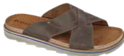
WZÓR ROZMIAR 158M008 40-46