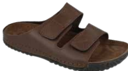
WZÓR ROZMIAR 158M005 40-46