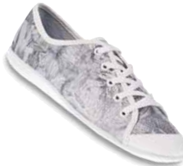
61 | 248Q023 36-40 Lena