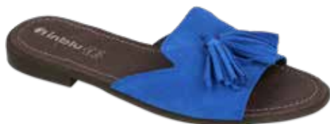
WZÓR ROZMIAR 158D150 36-41