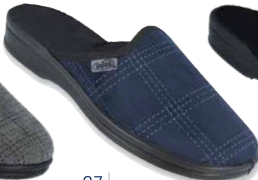
97 | 089M412 39-47 Parys