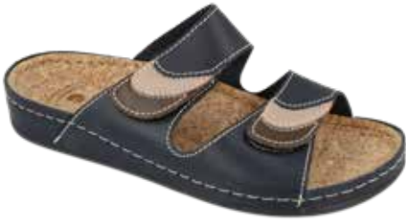
WZÓR ROZMIAR 158D173 36-41