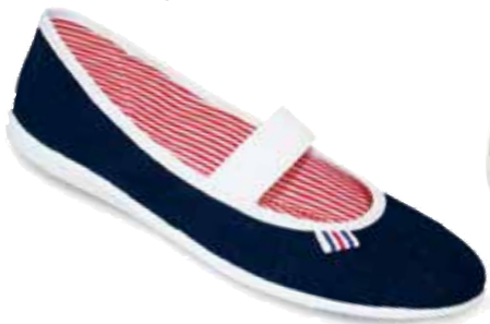
66 | 493Q002 37-39 Lena