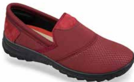
2 MODEL ROZMIAR 517D006 37-42