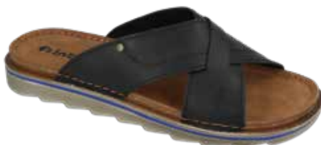
WZÓR ROZMIAR 158M006 40-46