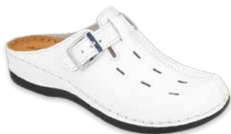
WZÓR ROZMIAR 158D143 36-41