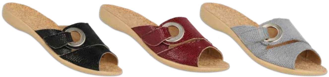
23 265D020 36-41 Viki