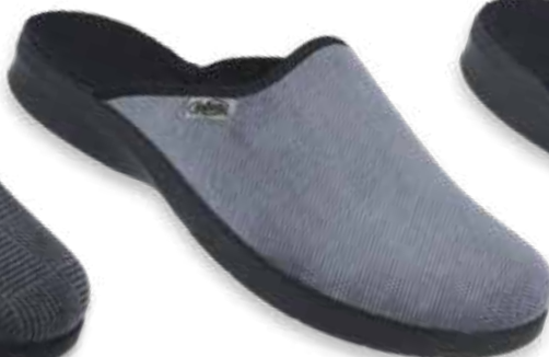
76 | 548M017 39-47 Leon