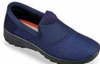
3 MODEL ROZMIAR 517D007 37-42