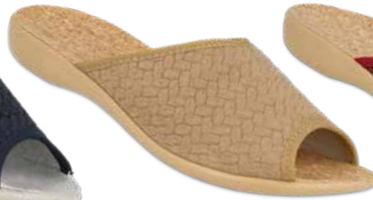
13 | 254D128 36-41 Viki