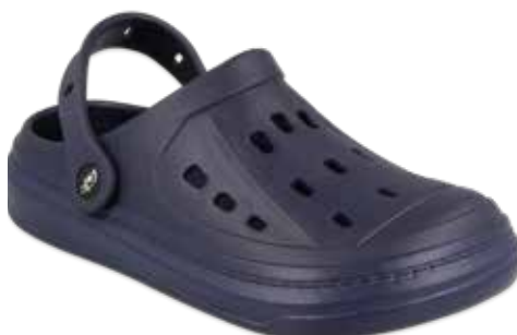
21 MODEL ROZMIAR 154M003 40-45