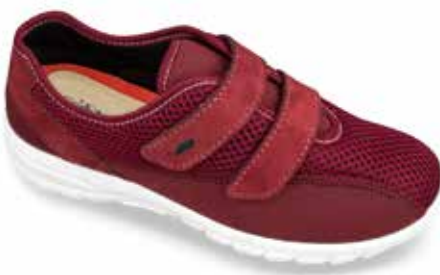
11 MODEL ROZMIAR 517D015 37-42