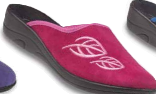
52 552D003 35-41 Jula