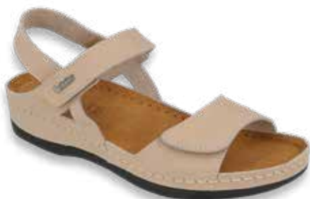
WZÓR ROZMIAR 158D102 36-41