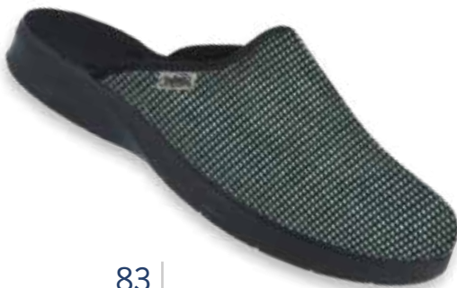
83 | 548M025 39-47 Leon