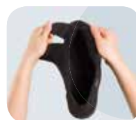
ROZPINANY JĘZYK I PIĘTA