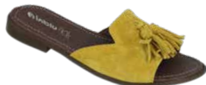
WZÓR ROZMIAR 158D149 36-41