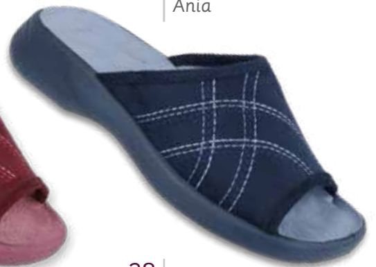
38 442D147 36-41 Olivia