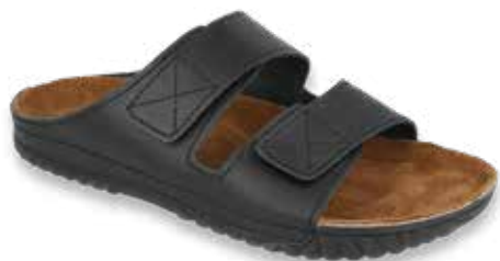
WZÓR ROZMIAR 158M003 40-46