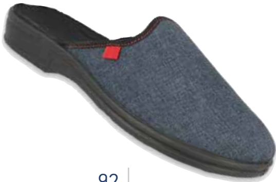
92 | 089M415 39-47 Parys