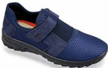
7 MODEL ROZMIAR 517D011 37-42