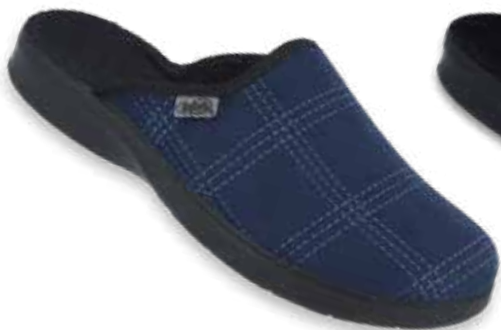
78 | 548M006 39-47 Leon