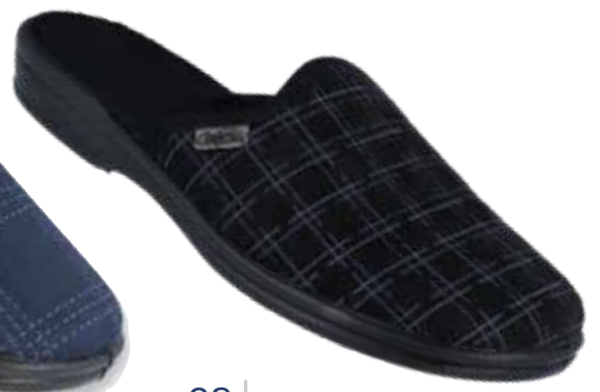
98 | 089M408 39-47 Parys