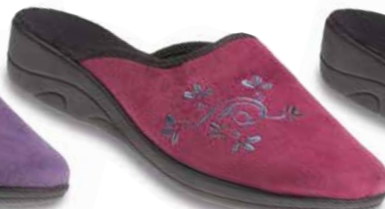
55 552D004 35-41 Jula