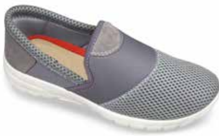
5 MODEL ROZMIAR 517D009 37-42