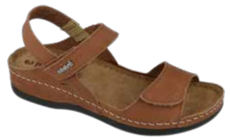
WZÓR ROZMIAR 158D162 36-41