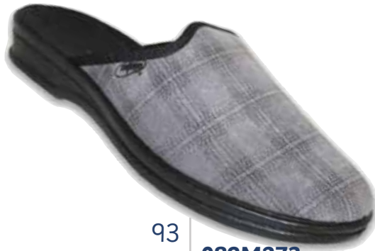
93 | 089M273 39-47 Parys