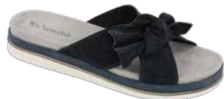
WZÓR ROZMIAR 158D156 36-41