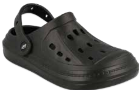
20 MODEL ROZMIAR 154M002 40-45