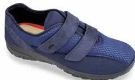
12 MODEL ROZMIAR 517D016 37-42