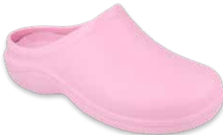
15 MODEL ROZMIAR 154D006 36-41