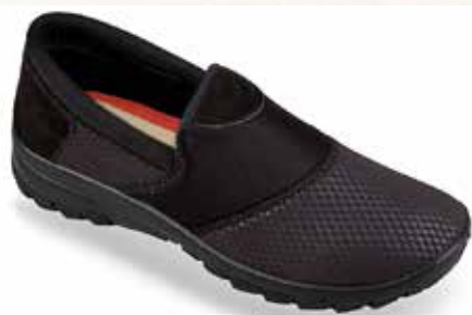
1 MODEL ROZMIAR 517D005 37-42