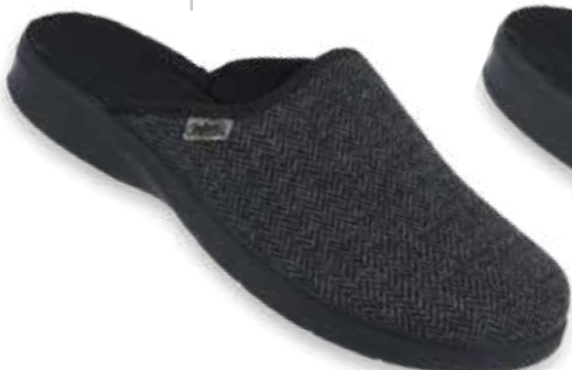
72 | 548M022 39-47 Leon