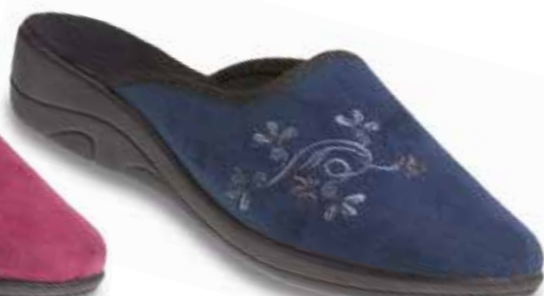
56 552D005 35-41 Jula