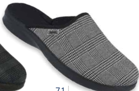
71 | 548M021 39-47 Leon