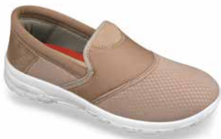
4 MODEL ROZMIAR 517D008 37-42