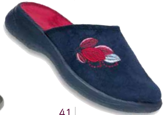
41 019D121 35-41 Olivia