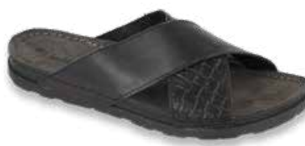
WZÓR ROZMIAR 158M002 40-46