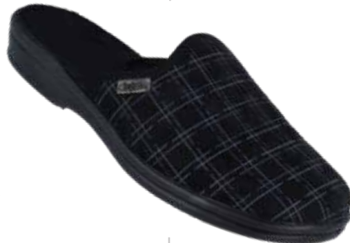
95 | 089M409 39-47 Parys