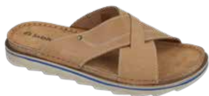
WZÓR ROZMIAR 158M007 40-46