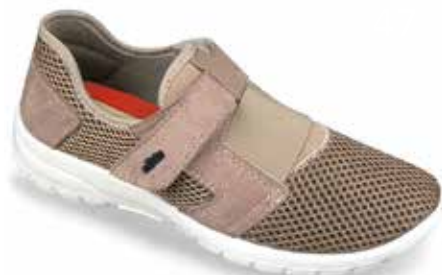
8 MODEL ROZMIAR 517D012 37-42