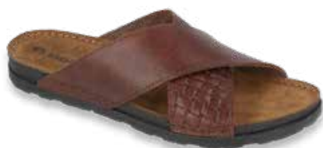
WZÓR ROZMIAR 158M001 40-46