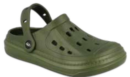
22 MODEL ROZMIAR 154M004 40-45