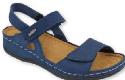
WZÓR ROZMIAR 158D101 36-41