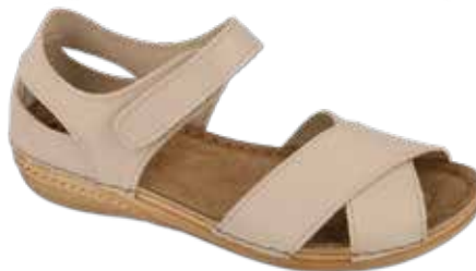
WZÓR ROZMIAR 158D179 36-41