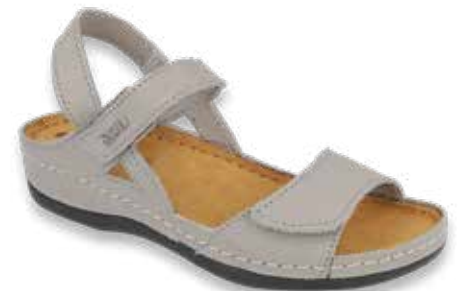
WZÓR ROZMIAR 158D103 36-41