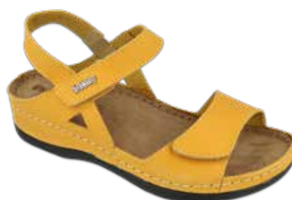
WZÓR ROZMIAR 158D161 36-41