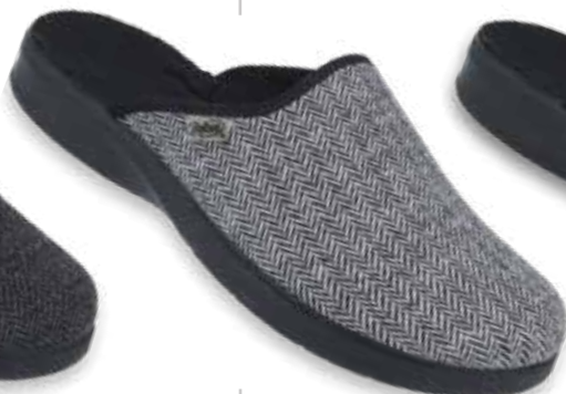
73 | 548M023 39-47 Leon