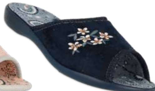
8 254D122 36-41 Viki