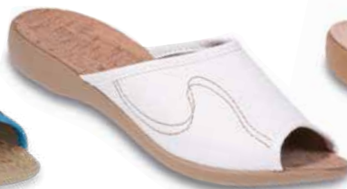
21 | 254D058 36-41 Viki