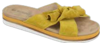
WZÓR ROZMIAR 158D153 36-41