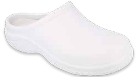
13 MODEL ROZMIAR 154D004 36-41