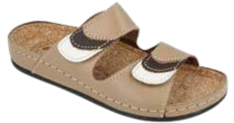
WZÓR ROZMIAR 158D174 36-41