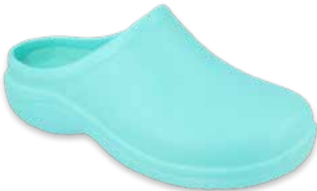
14 MODEL ROZMIAR 154D005 36-41