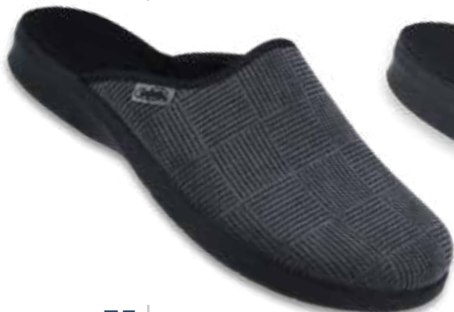
75 | 548M014 39-47 Leon