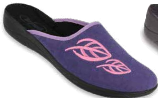
51 552D001 35-41 Jula