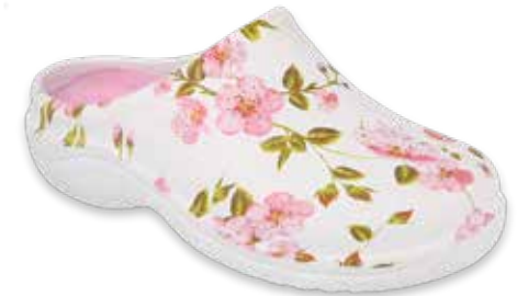
16 MODEL ROZMIAR 154D101 36-41