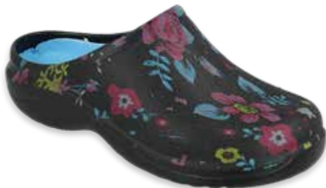
17 MODEL ROZMIAR 154D102 36-41