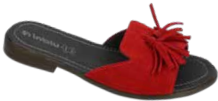
WZÓR ROZMIAR 158D148 36-41