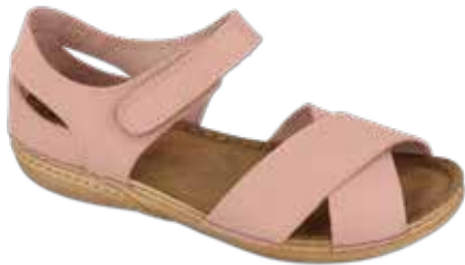
WZÓR ROZMIAR 158D181 36-41