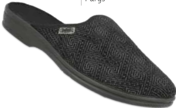
94 | 089M363 39-47 Parys