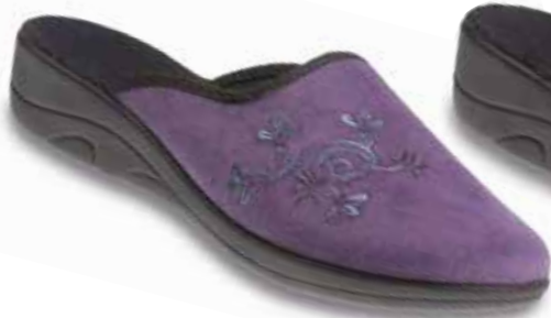
54 552D006 35-41 Jula