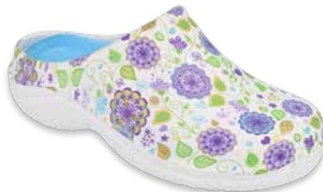
18 MODEL ROZMIAR 154D103 36-41