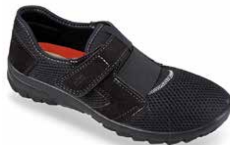
6 MODEL ROZMIAR 517D010 37-42