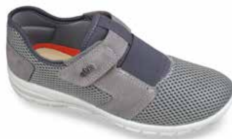
9 MODEL ROZMIAR 517D013 37-42