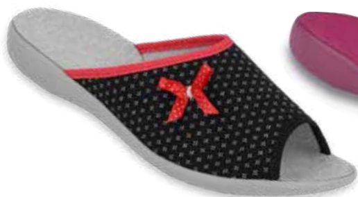
9 254D109 36-41 Viki