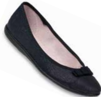
62 | 309Q018 36-40 Lena