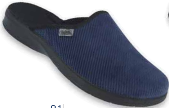
81 | 548M019 39-47 Leon