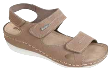
WZÓR ROZMIAR 158D158 36-41