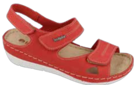
WZÓR ROZMIAR 158D157 36-41