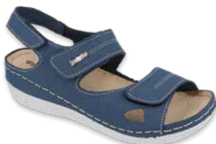
WZÓR ROZMIAR 158D142 36-41