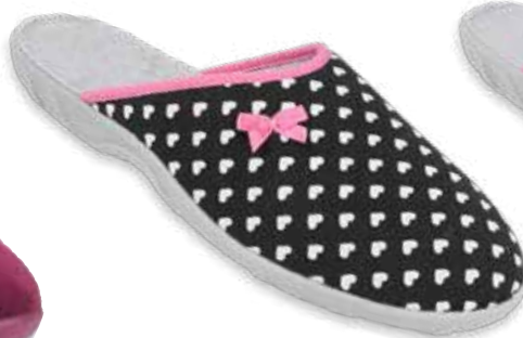
46 B 235D172 36-41 Paula