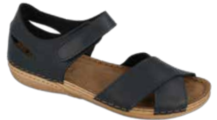
WZÓR ROZMIAR 158D180 36-41