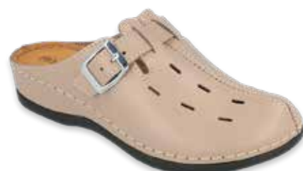
WZÓR ROZMIAR 158D138 36-41