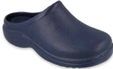
12 MODEL ROZMIAR 154D003 36-41