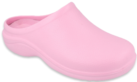
139 154D006 36-41 róż, růžový, pink