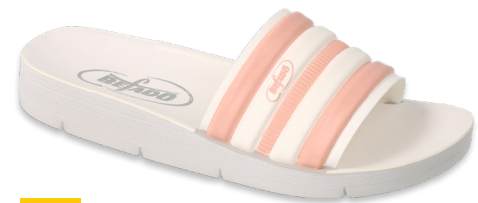
108 067Y004 CLIP 28-35