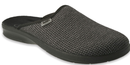
057 548M026 39-47 popiel, šedý, ashen