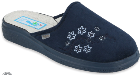
164 132D012 36-41 granat, granátový, navy