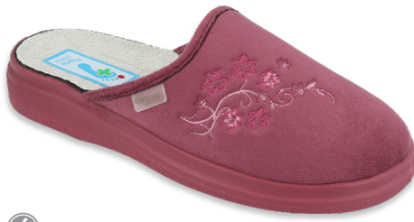
165 132D014 36-41 bordo, bordó, burgundy