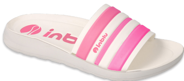
105 067D002 CLIP 35-41