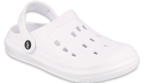
141 154M001 40-45* biały, bílý, white