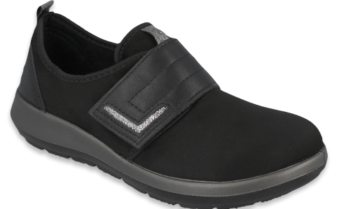
127 156D002 36-41 czarny, černý, black