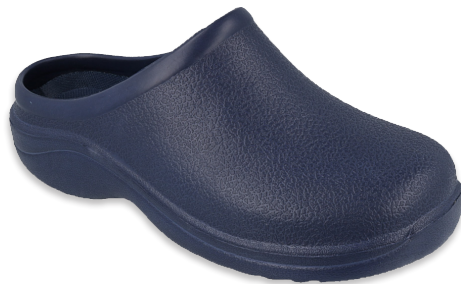
137 154D003 36, 37, 41 granat, granátový, navy