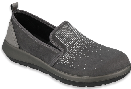
123 156D005 36-40 szary, šedý, gray