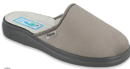
168 132D010 36-41 132M010 42-48 popiel, šedý, ashen