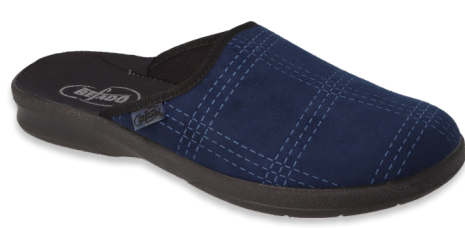
055 548M006 39-47 granat, granátový, navy