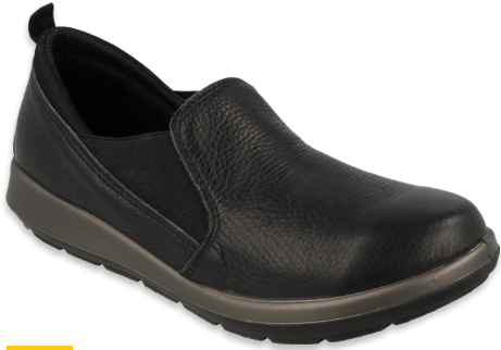
119 156D102 36-39 czarny, černý, black