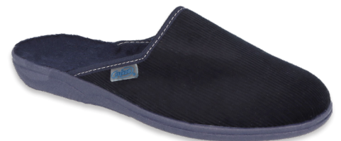
067 201Q033 40-47 granat, granátový, navy