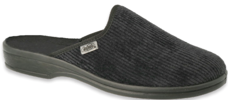
063 089M419 39-47 czarny, černý, black