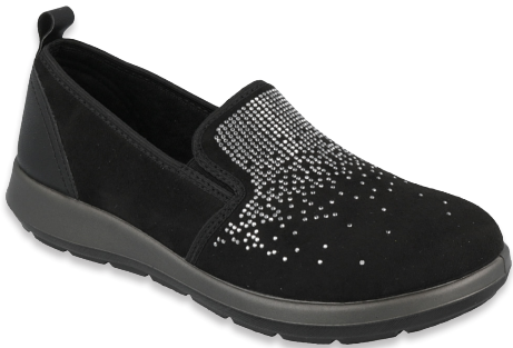
122 156D004 36-38 czarny, černý, black