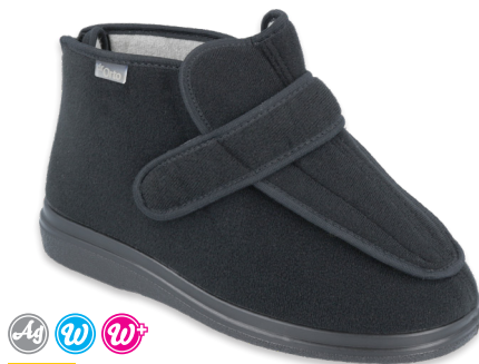
174 987D002 36-41 987M002 42-48 czarny, černý, black