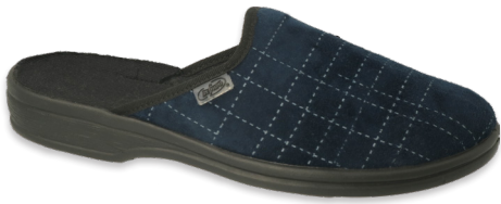
060 089M409 40-47 granat, granátový, navy