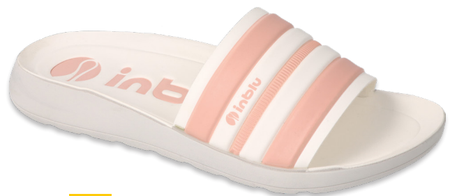
106 067D001 CLIP 35-41