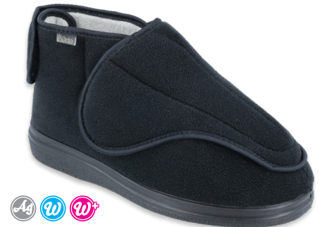
172 163D002 36-41 163M002 42-48 czarny, černý, black