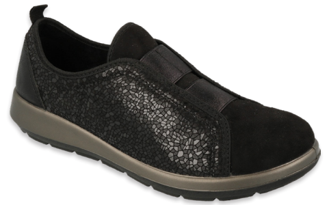
121 156D104 36-39 czarny, černý, black