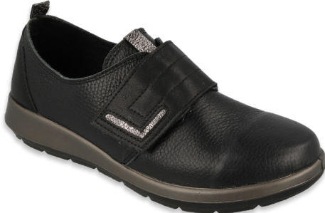
126 156D103 36-38 czarny, černý, black