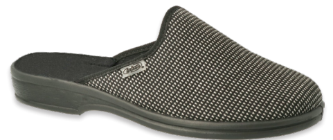
065 089M422 39-47 czarny, černý, black