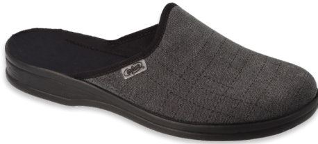
061 089M410 40-47 popiel, šedý, ashen