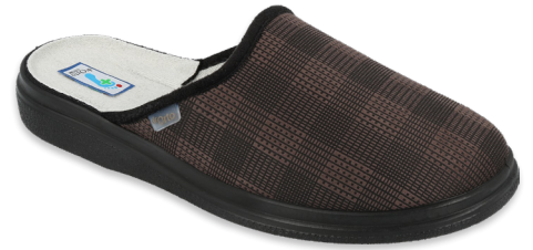
166 132M017 42-48 brąz, hnědý, brown