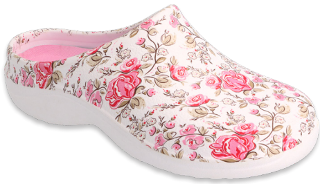
134 154D104 37-41 wielobarwny, vícebarevný, multicolor