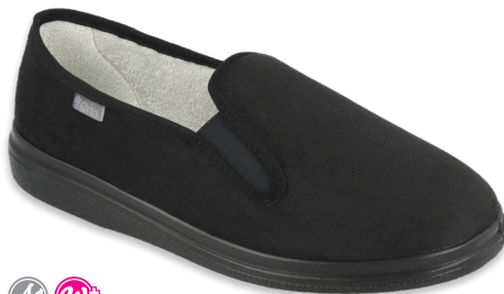
171 991M002 39-48 czarny, černý, black