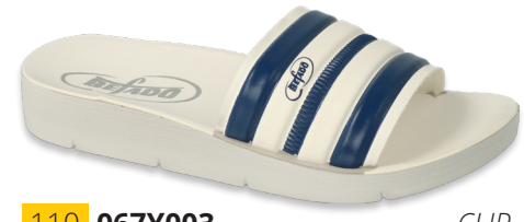
110 067Y003 CLIP 28-35