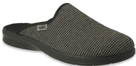
053 548M031 39-47 czarno/biały, černý a bílý, black/white