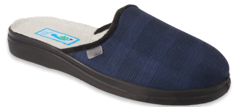
169 132M015 42-48 granat, granátový, navy