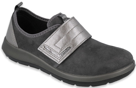
125 156D003 36-41 szary, šedý, gray