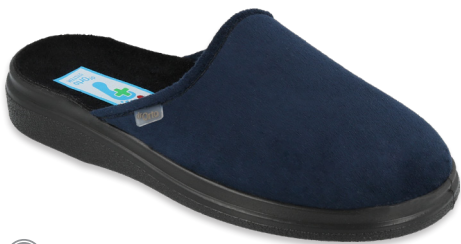
167 132D006 36-41 132M006 42-48 granat, granátový, navy