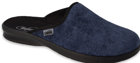
051 548M033 39-47 granat, granátový, navy