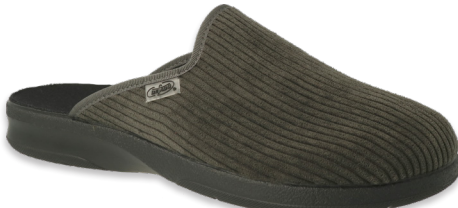
059 548M028 39-47 khaki