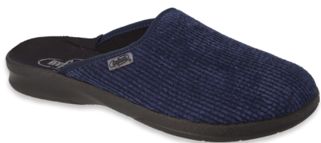
058 548M029 39-47 granat, granátový, navy