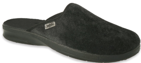
050 548M032 39-47 czarny, czerný, black