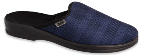
062 089M414 40-47 granat, granátový, navy