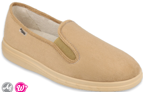
170 991M001 42-48 bež, béžový, beige