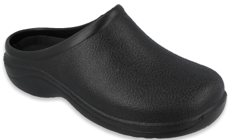
136 154D001 36-41 czarny, černý, black