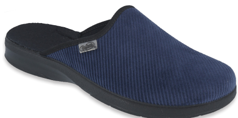
056 548M019 39-47 granat, granátový, navy