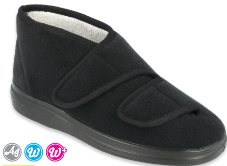
173 986D003 36-41 986M003 42-48 czarny, černý, black