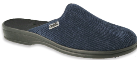
064 089M421 40-47 granat, granátový, navy