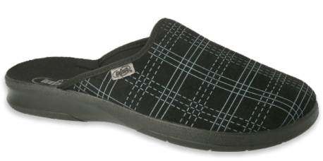
054 548M003 39-47 czarny, czerný, black