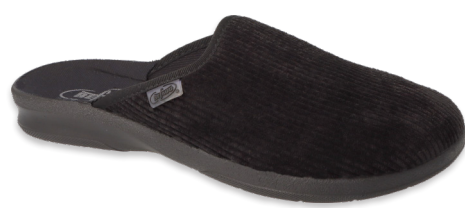
052 548M030 39-47 czarny, czerný, black