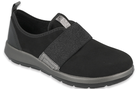
124 156D001 36-41 czarny, černý, black