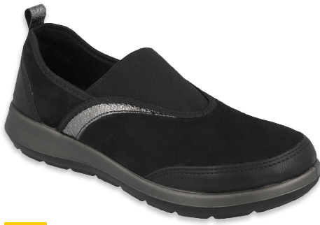
120 156D006 36-39 czarny, černý, black