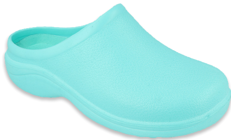
140 154D005 36, 37, 40, 41 turkus, tyrkysový, turquoise