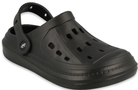
142 154M002 40-45* czarny, černý, black