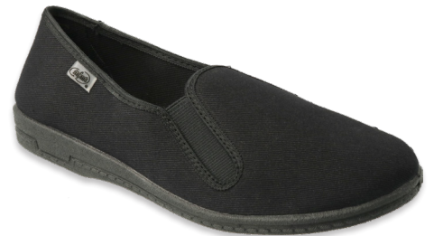
066 001M060 40-47 czarny, černý, black