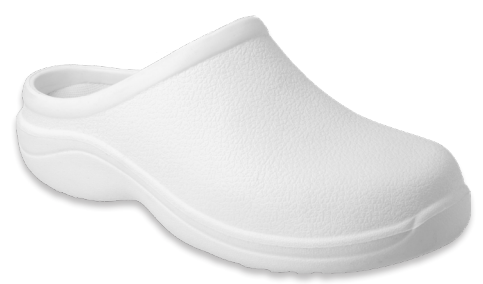
138 154D004 36-41 biały, bílý, white