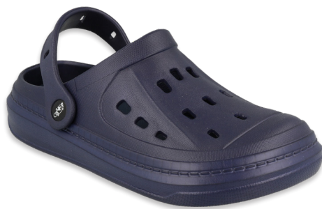
143 154M003 40-45* granat, granátový, navy