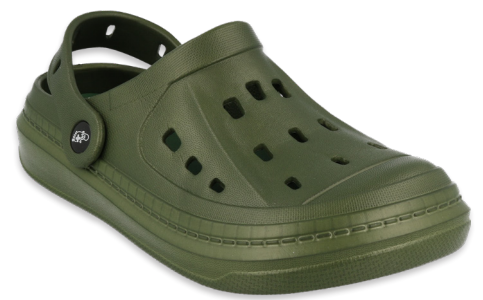
144 154M004 40-45* zielony, zelený, green

* zanižene o dva rozmiary / sníženo o dva čísla / two sizes smaller