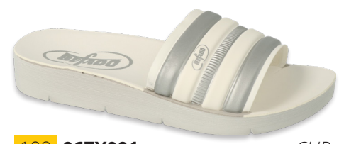
109 067Y001 CLIP 28-35