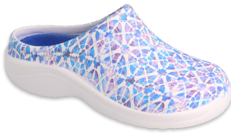
135 154D106 37-41 wielobarwny, vícebarevný, multicolor