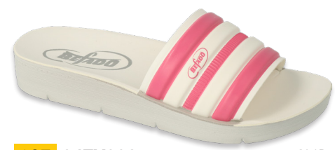
107 067Y002 CLIP 28-35