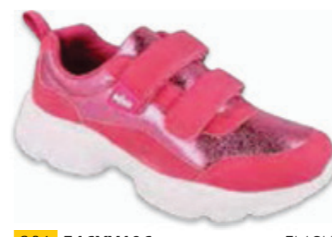
201 516XY106 FLASH 25-30 / 31-36