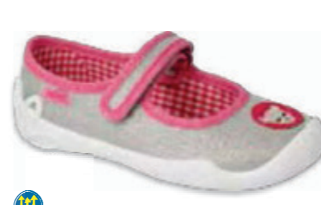
117 114X501 BLANCA 25-30