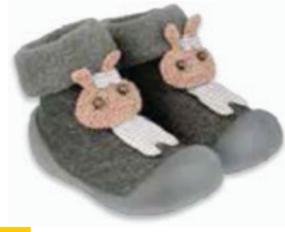
014 002P031 NIECHODKI 18, 20, 22