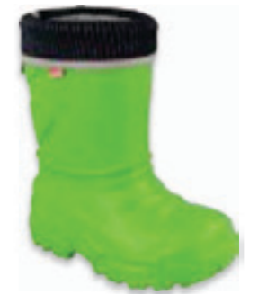
006 162Y303 KALOSZE 31-36