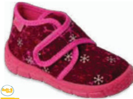
041 538P106 HONEY 18-24