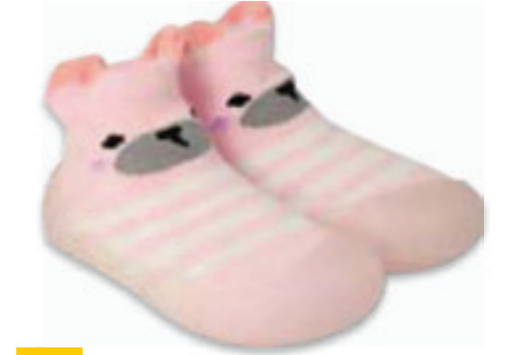
022 002P014 NIECHODKI 18