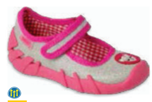
057 109P251 SPEEDY 18-26