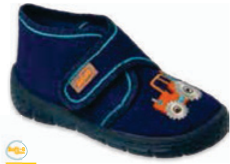
051 538P079 HONEY 20-26