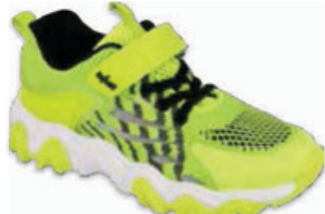
210 516XY104 WAVE 26-30 / 31-36