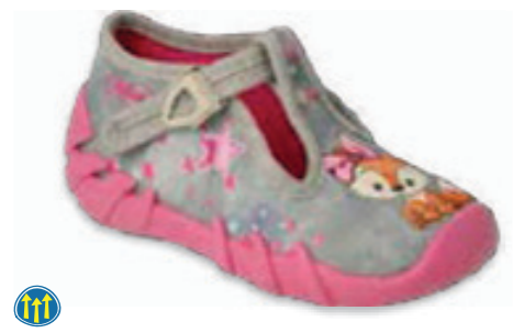
070 110P467 SPEEDY 18-26