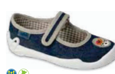
118 114X498 BLANCA 27-30