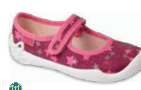
116 114X507 BLANCA 27-30