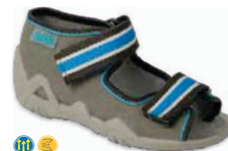
098 250P102 SNAKE 18-26