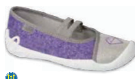
133 116Y314 BLANCA 25-30