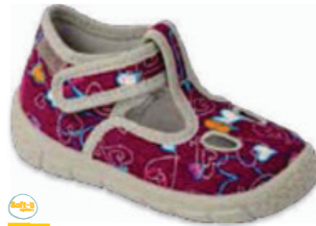
042 630P002 HONEY 18-24