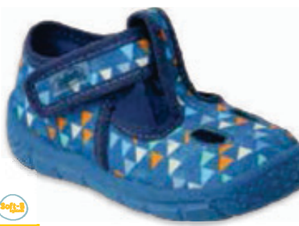
049 533P023 HONEY 19-26