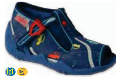
092 217P117 SNAKE 18-26