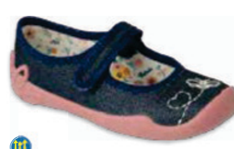
114 114X489 BLANCA 27-30