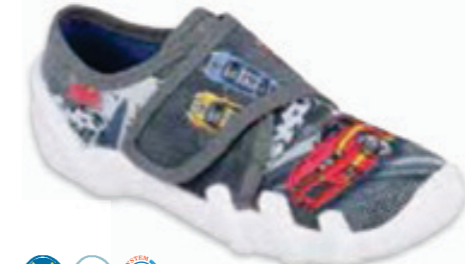
151 273X315 SKATE 25-30