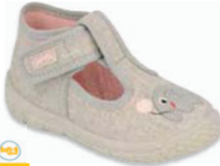
043 531P103 HONEY 18-26