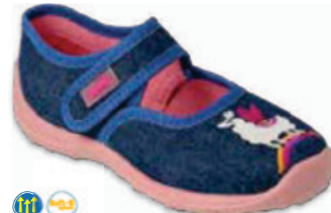
125 661XY008 BOOGY 25-30 / 31-36