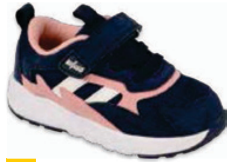
183 516P124 FIRE 20-24