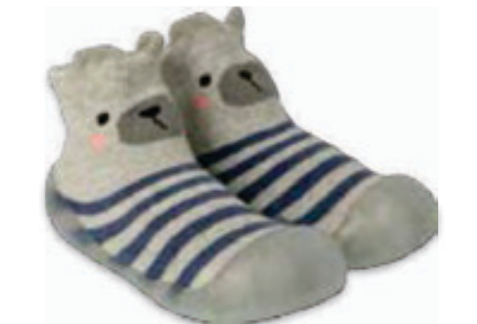
025 002P021 NIECHODKI 20, 22