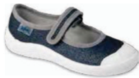
123 208XY048 TIM 25-30 / 31-36