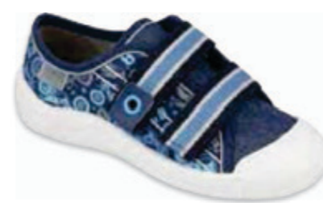
137 672X073 TIM 25-30