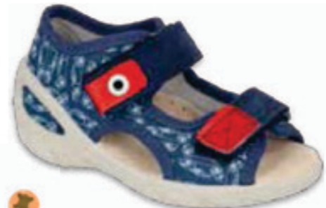
103 065PX165 SUNNY 20-25 / 26-30