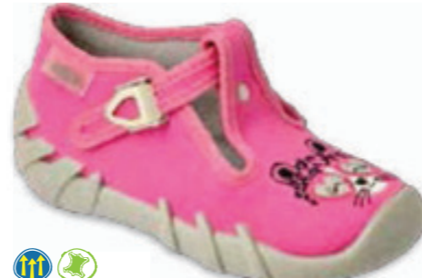
066 110P452 SPEEDY 18-26