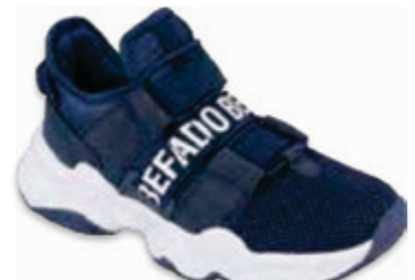
213 516X065 MODERN 27-29