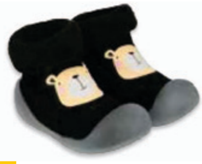
010 002P023 NIECHODKI 18, 20, 22