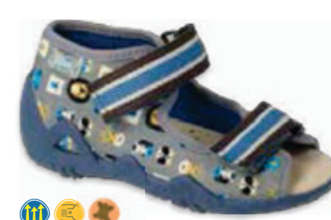
099 350P034 SNAKE 18-26

WYJĄTKOWO ELASTYCZNA PODESZWA / FLEXIBLE SOLE / PRUŽNÁ ELASTICKÁ PODEŠEV