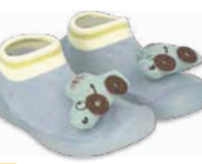
019 002P039 NIECHODKI 18, 20, 22