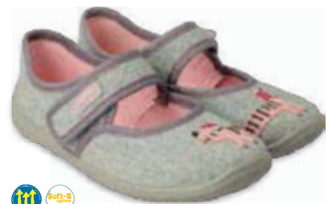
129 955X006 MELLY 25-30