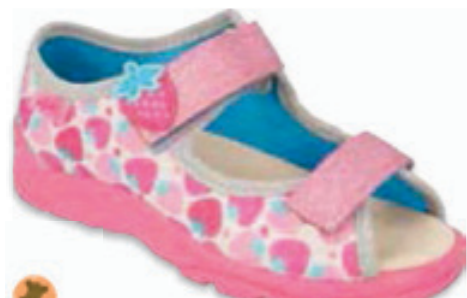
105 869XY170 MAX 25-30 / 31-33