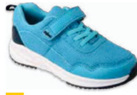
195 516P116 LINE 22-24