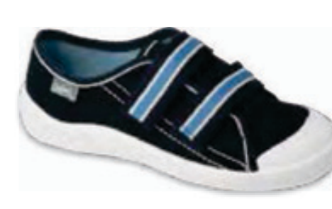
139 672Y049 TIM 31-34