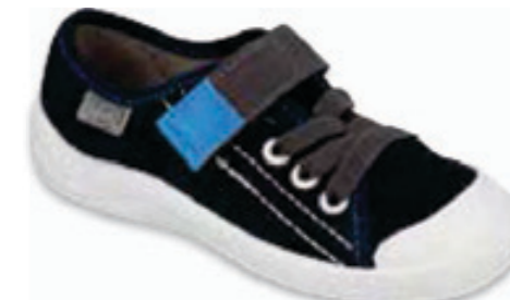
136 251XY047 TIM 25-30 / 31-36