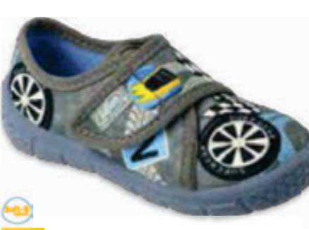
050 557P144 HONEY 20-26