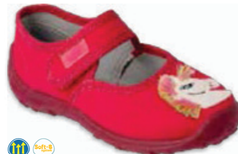
124 661X009 BOOGY 25-30