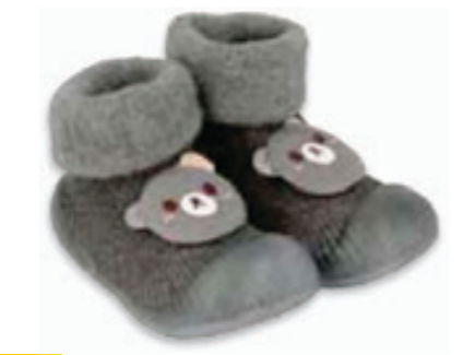
018 002P035 NIECHODKI 18, 20, 22