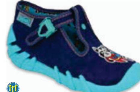
075 110P440 SPEEDY 18-26