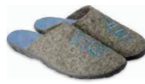
170 235D188 PAULA 36-41