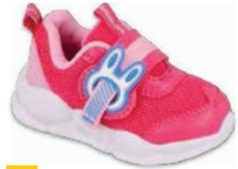
186 516P089 RABBIT 20-25