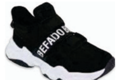
214 516X066 MODERN 27-29