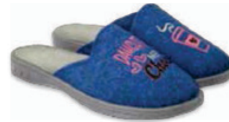
173 707Y429 JOGI 31-36