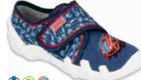
153 273Y338 SKATE 31-36