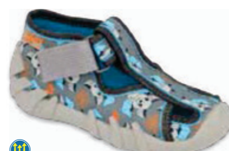
083 190P104 SPEEDY 18-26