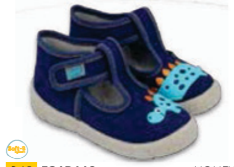
048 531P118 HONEY 18-26