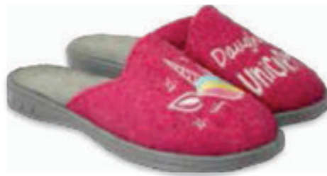
171 707X427 JOGI 26-30