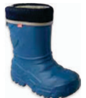
004 162XY306 KALOSZE 25-29 / 30-36