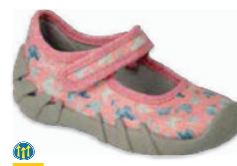
056 109P252 SPEEDY 20-26