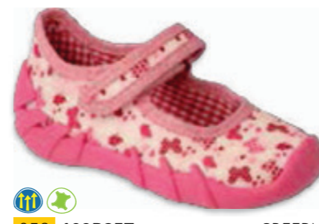
058 109P257 SPEEDY 18-26