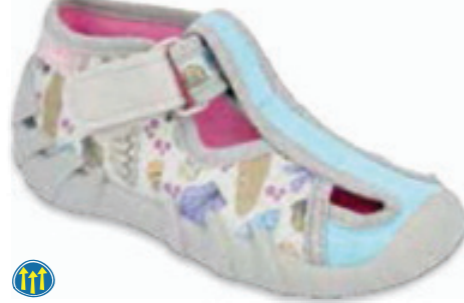
071 190P098 SPEEDY 21-26