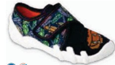
152 273XY345 SKATE 25-30 / 31-36