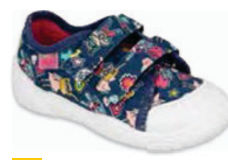
053 907P149 MAXI 18-26