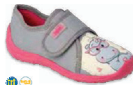
111 660X016 BOOGY 25-30