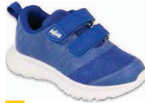
194 516P088 MONO 22-25