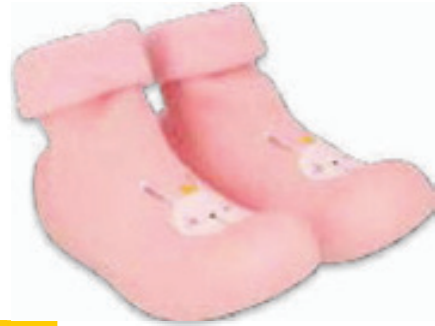
009 002P022 NIECHODKI 18, 20, 22