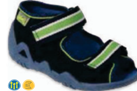
097 250P103 SNAKE 18-26