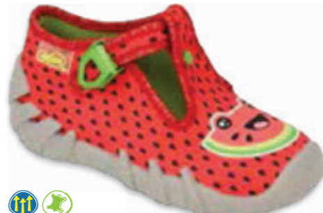
065 110P459 SPEEDY 18-26