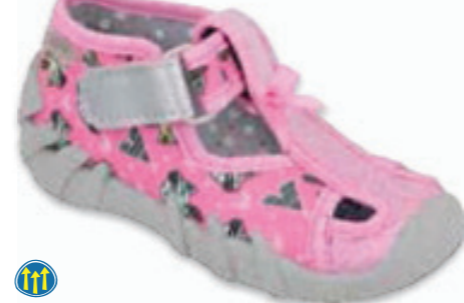
072 190P102 SPEEDY 20-25