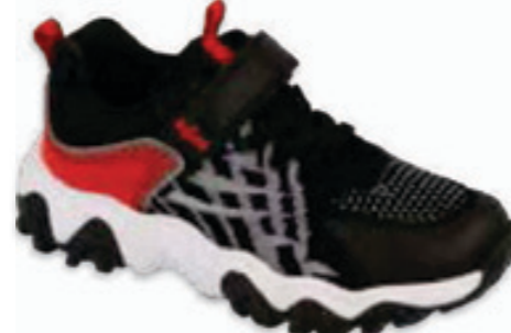
208 516X103 WAVE 26-30