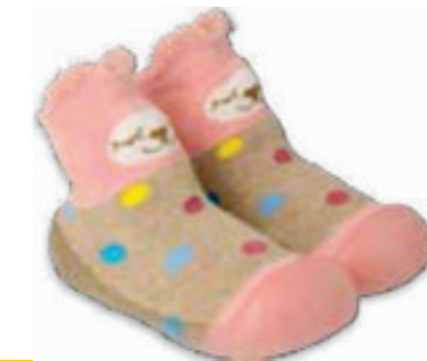
027 002P019 NIECHODKI 20, 22