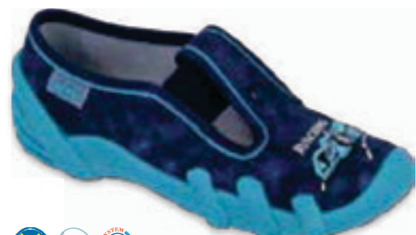
143 290X173 SKATE 25-30