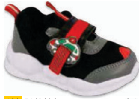
189 516P096 CAR 21-25