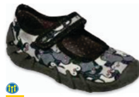
055 109P239 SPEEDY 18-26