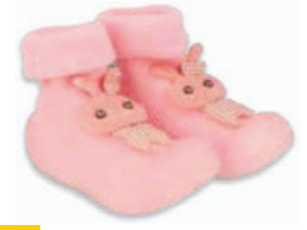
012 002P029 NIECHODKI 18, 20, 22