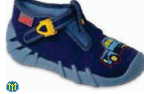
080 110P446 SPEEDY 18-26