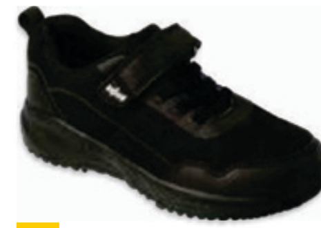
200 516P118 LINE 20-24