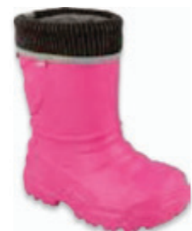
003 162XY301 KALOSZE 29 / 30-36