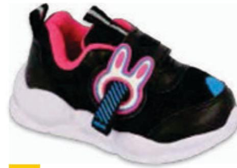
188 516P092 RABBIT 20-25