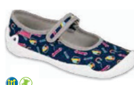
120 114Y502 BLANCA 31-36