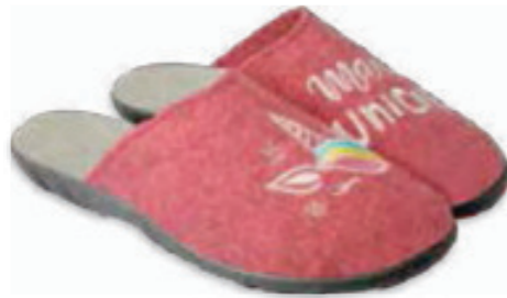
168 235D186 PAULA 36-41