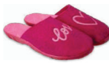
169 235D187 PAULA 36-41