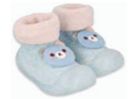
015 002P032 NIECHODKI 18, 20, 22