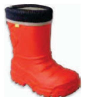
008 162XY308 KALOSZE 25-29 / 30-36