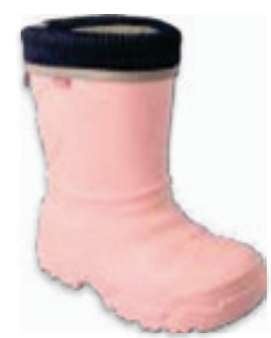
001 162XY307 KALOSZE 25-29 / 30-36