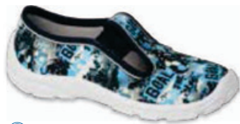
140 975X174/Y173 DANNY 25-30 / 31-36