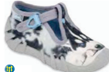
073 110P417 SPEEDY 18-25