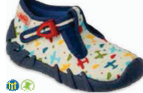
079 110P463 SPEEDY 18-26