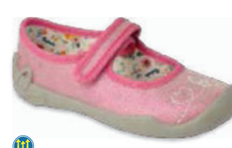
115 114X493 BLANCA 27-30