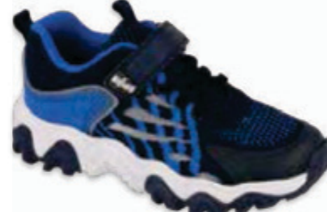
209 516X102 WAVE 26-30