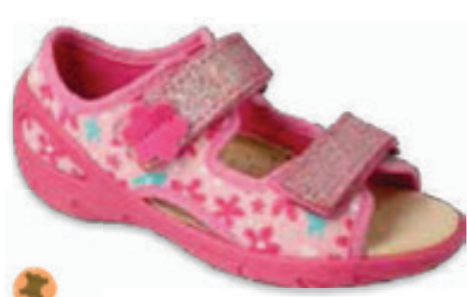
100 065P178 SUNNY 20-25