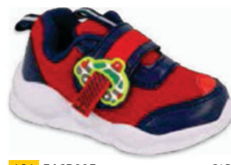
191 516P095 CAR 20-25