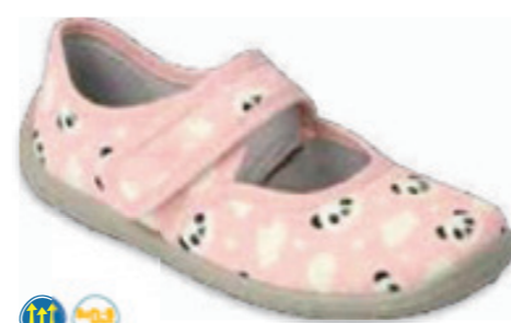
128 955X021 MELLY 25-30