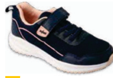
196 516P111 LINE 20-24