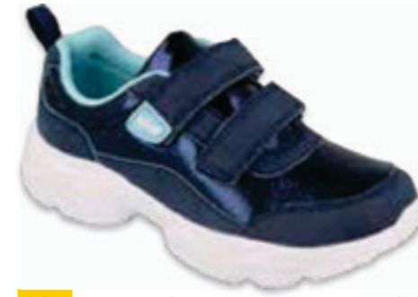
204 516XY109 FLASH 25-30 / 31-36