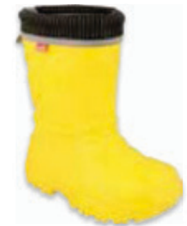
005 162XY302 KALOSZE 25-30 / 31-36