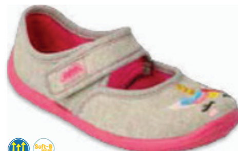
127 955X024 MELLY 25-30