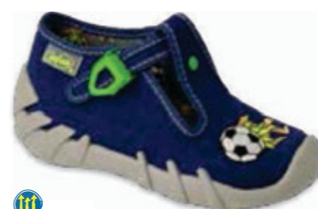
076 110P445 SPEEDY 18-26