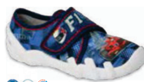
150 273X266 SKATE 25-30