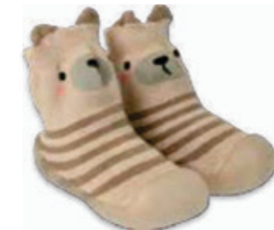
024 002P020 NIECHODKI 20, 22