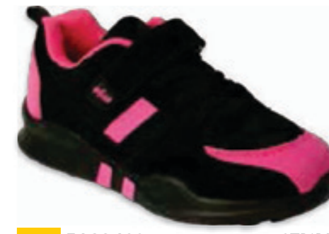
206 516Q129 STRIPE 39-41