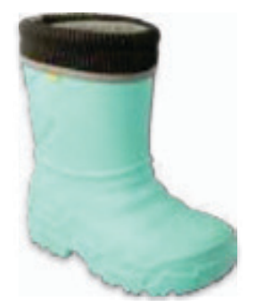
002 162XY305 KALOSZE 25-29 / 30-36