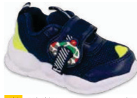
190 516P094 CAR 21-25