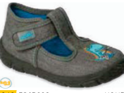
046 531P098 HONEY 19-26