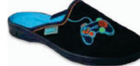
178 707Y420 JOGI 31-36