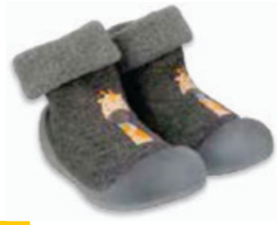
011 002P024 NIECHODKI 18, 20, 22