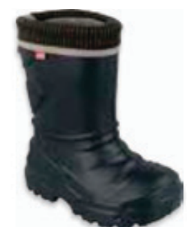
007 162XY304 KALOSZE 25-30 / 31-36