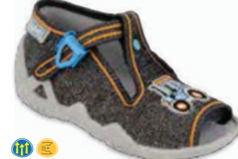
093 217P111 SNAKE 19-26