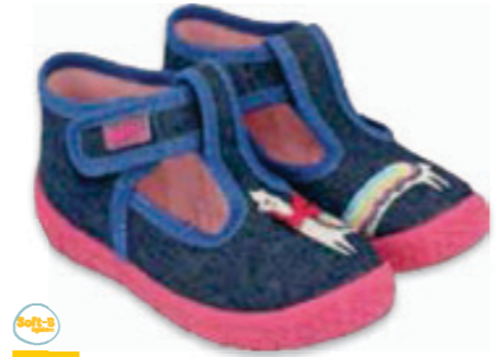
045 531P117 HONEY 18-26