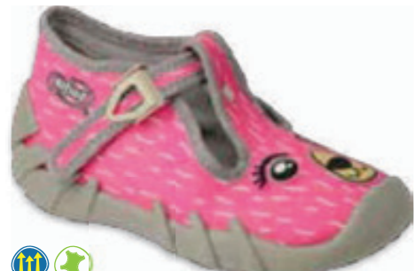
067 110P468 SPEEDY 18-26