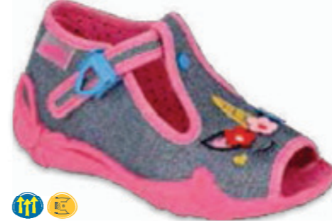
087 213P134 PAPI 18-26