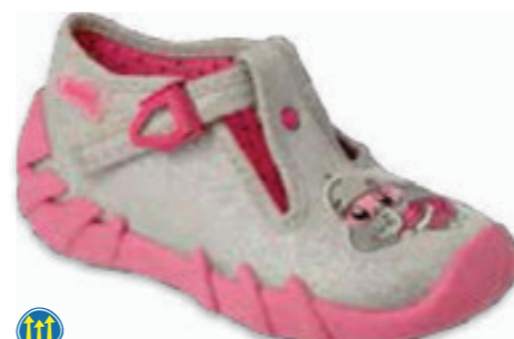
069 110N454 SPEEDY 18-26