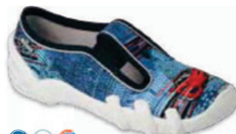
145 290XY269 SKATE 27-30 / 31-36