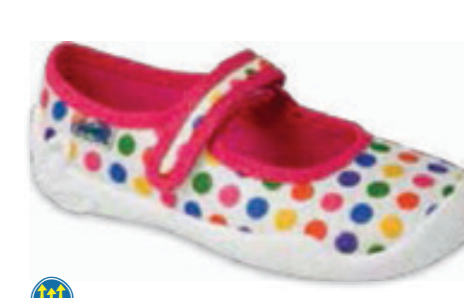
119 114X494 BLANCA 25-30