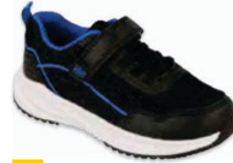
197 516P114 LINE 20-24