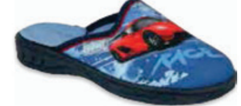
176 707XY419 JOGI 26-30 / 31-36