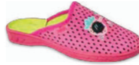
174 707XY422 JOGI 26-30 / 31-36