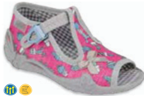
089 213P128 PAPI 18-23