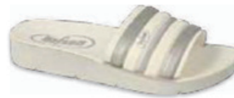
180 067Y001 CLIP 28-35