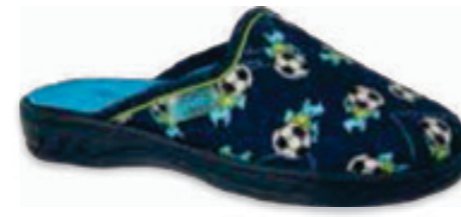
177 707XY421 JOGI 26-30 / 31-36