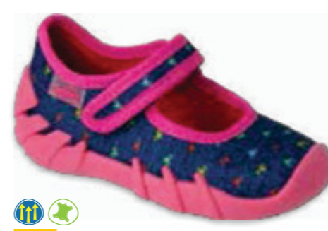
061 109P255 SPEEDY 18-26