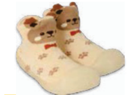
028 002P037 NIECHODKI 20, 22