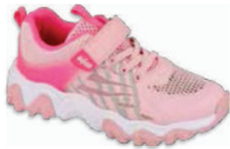
207 516XY101 WAVE 26-30 / 31-36