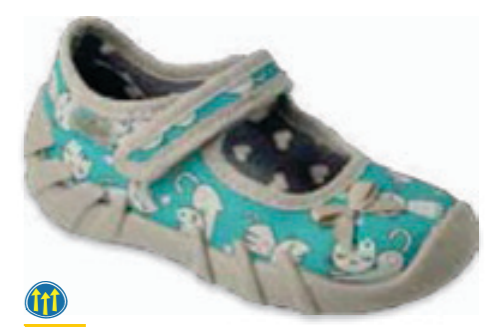
063 109P238 SPEEDY 18-26

SYSTEM OCHRONY STÓP / FOOT PROTECTION SYSTEM / SYSTÉM OCHRANY CHODIDEL