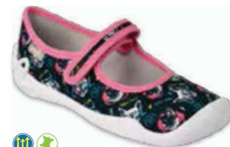
121 114Y497 BLANCA 31-36