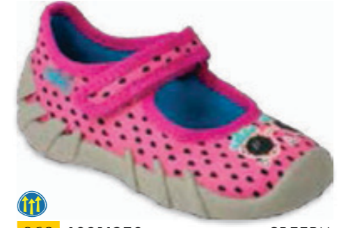
060 109N250 SPEEDY 19-26