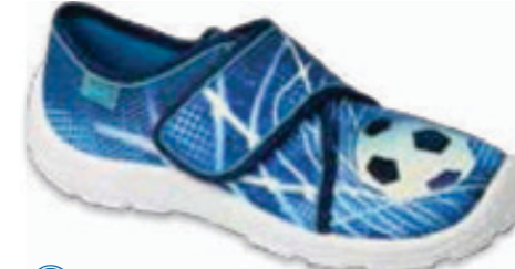
149 974Y312 DANNY 31-32