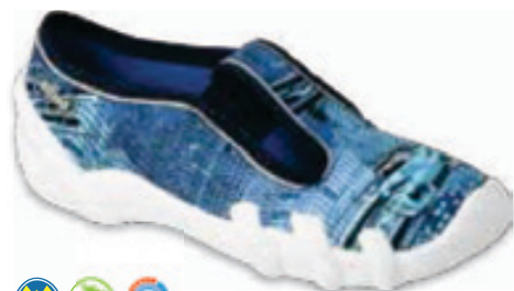
146 290XY270 SKATE 27-30 / 31-36