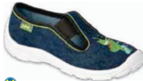
141 975X171 DANNY 25-30