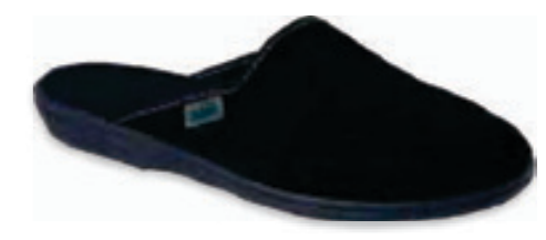
179 201Q033 BENNY 37-40