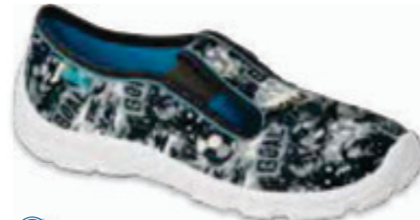
142 975Y172 DANNY 31-36