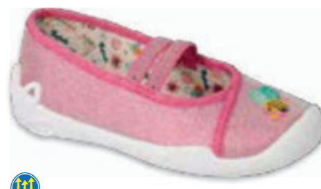
132 116X311 BLANCA 25-30