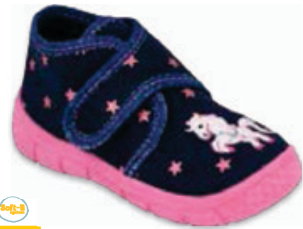
040 538P015 HONEY 19-26