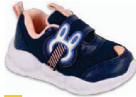
187 516P090 RABBIT 20-25