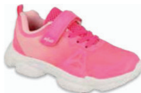
211 516Q119 RAINBOW 37-39