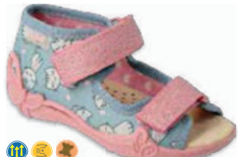
090 342P040 PAPI 18-26