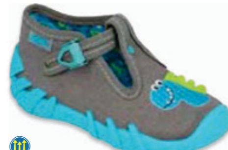
077 110P441 SPEEDY 18-26