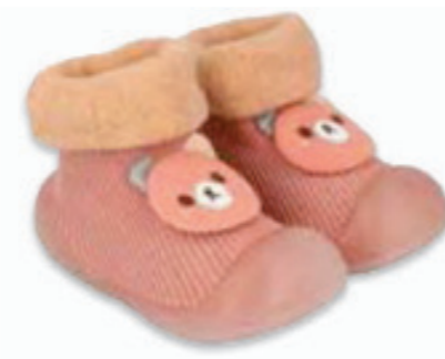
017 002P034 NIECHODKI 18, 20, 22