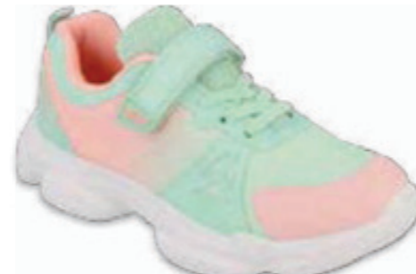
212 516Q120 RAINBOW 37-39