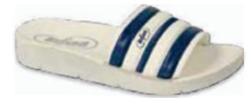
182 067Y003 CLIP 28-35