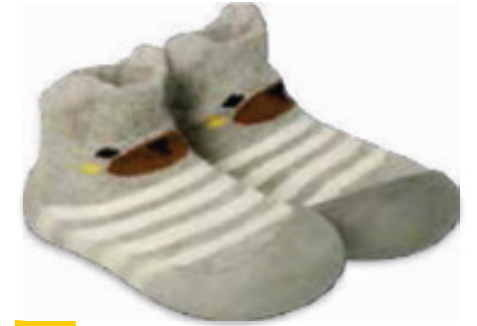
021 002P012 NIECHODKI 18