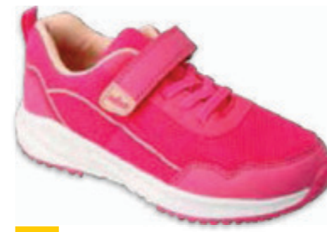
199 516P113 LINE 20-22