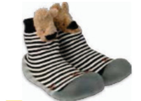
026 002P028 NIECHODKI 18, 20, 22