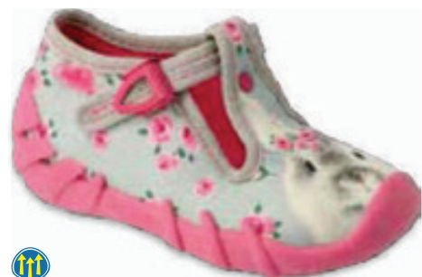
064 110P425 SPEEDY 18-26