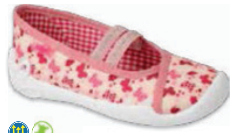
131 116X310 BLANCA 25-30