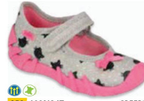
059 109N247 SPEEDY 19-26