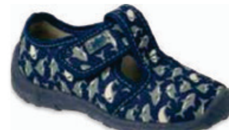
154 010X032 BOOGY 25-30