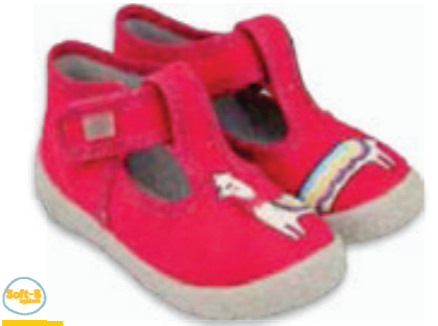
044 531P119 HONEY 18-26