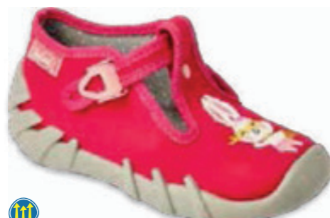
068 110P451 SPEEDY 18-26