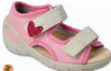
101 065X173 SUNNY 26-30