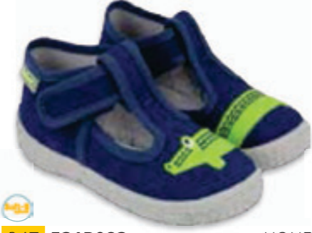
047 531P083 HONEY 20-26