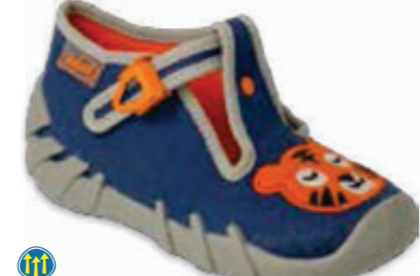
074 110P462 SPEEDY 18-26