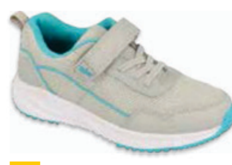
198 516P112 LINE 20-24