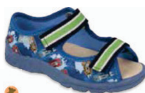
107 869X163 MAX 25-26