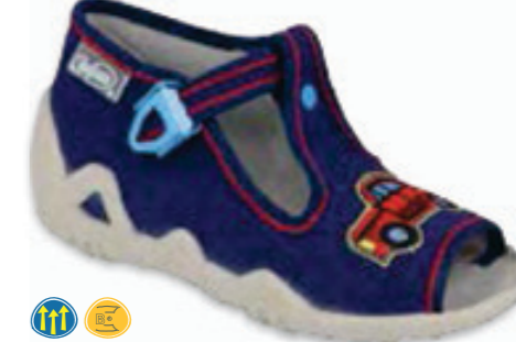
094 217P115 SNAKE 19-26