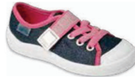
134 351X001 TIM 25-30