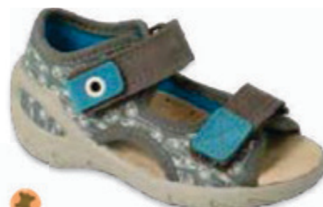
104 065P169 SUNNY 20-25