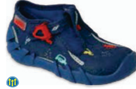
081 110P461 SPEEDY 18-26