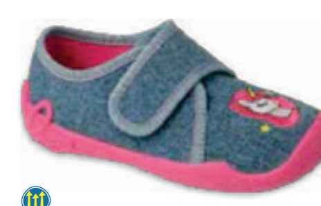
113 122X016 BLANCA 25-30