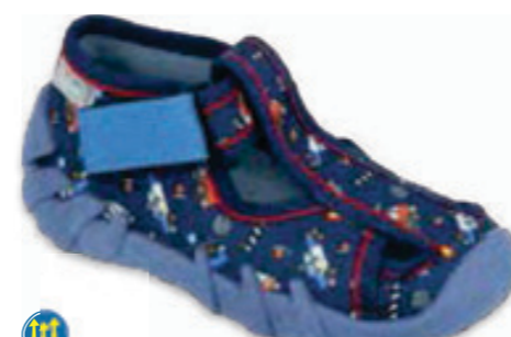
082 190P103 SPEEDY 18-21