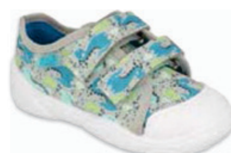
084 907P156 MAXI 18-26

PODESZWA ODDYCHAJĄCA / BREATHABLE SOLE / DÝCHAJÍCÍ PODRÁŽKA