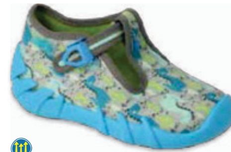
078 110P465 SPEEDY 18-26