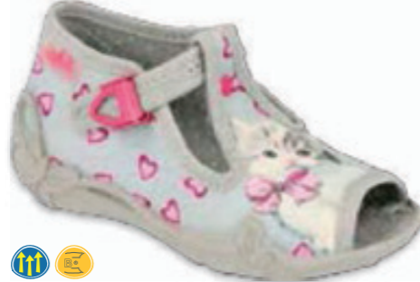
086 213P131 PAPI 18-25