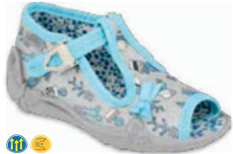
088 213P127 PAPI 18-23