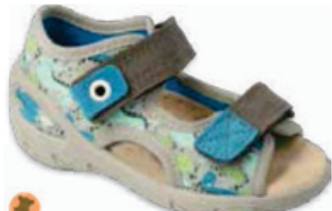
102 065P164 SUNNY 20-25