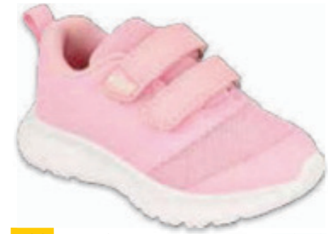
193 516P085 MONO 22-25