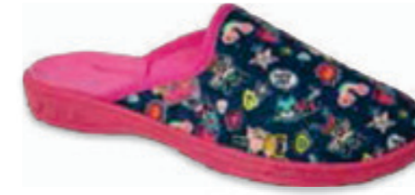
175 707XY423 JOGI 26-30 / 31-36