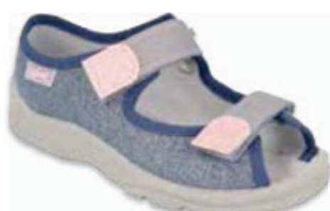
106 969XY167 MAX 25-30 / 31-36