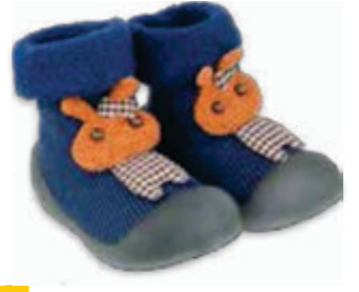
013 002P030 NIECHODKI 18, 20, 22