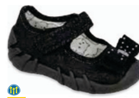
062 109P146 SPEEDY 18-22