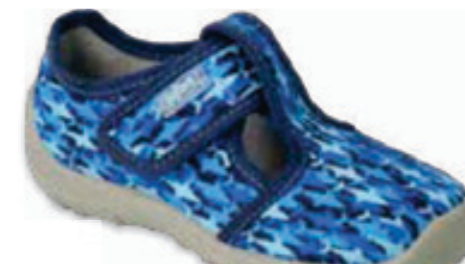
155 010X025 BOOGY 25-30

PODESZWA ODDYCHAJĄCA / BREATHABLE SOLE / DÝCHAJÍCÍ PODRÁŽKA