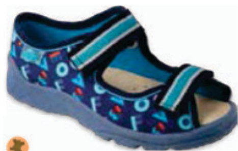
108 869XY165 MAX 25-30 / 31-33