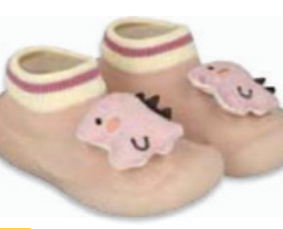
020 002P040 NIECHODKI 18, 20, 22