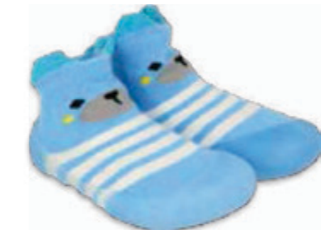
023 002P015 NIECHODKI 18