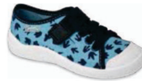
135 351X009 TIM 25-30