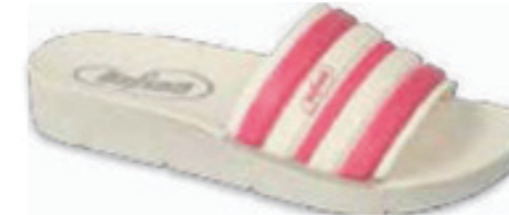
181 067Y002 CLIP 28-35