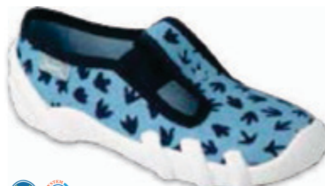
144 290X268 SKATE 25-30