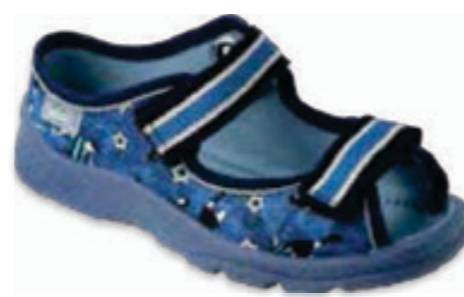
110 969XY141 MAX 25-26 / 31-33