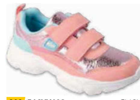
202 516XY108 FLASH 25-30 / 31-36