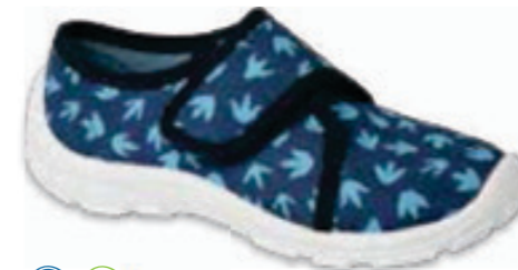
148 974XY476 DANNY 25-30/31-36