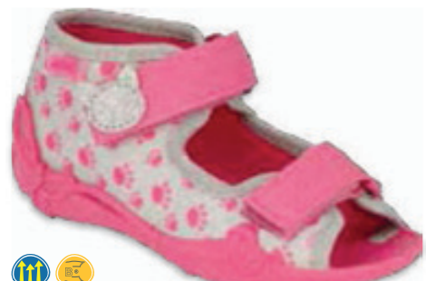
091 242P109 PAPI 18-26