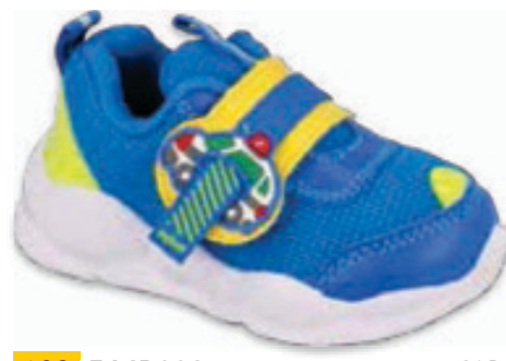
192 516P093 CAR 20-25