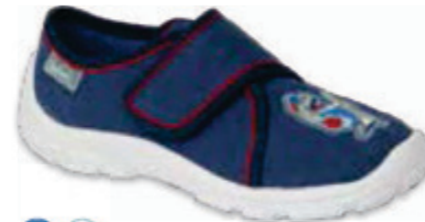
147 974X475 DANNY 25-30