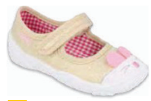
054 209P035 MAXI 18-22