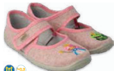
126 955X025 MELLY 25-30