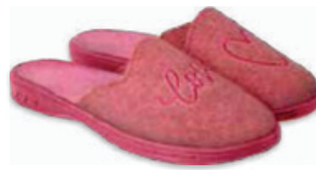
172 707Y428 JOGI 31-36