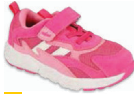
184 516P123 FIRE 20-24