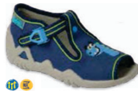
095 217P116 SNAKE 18-26