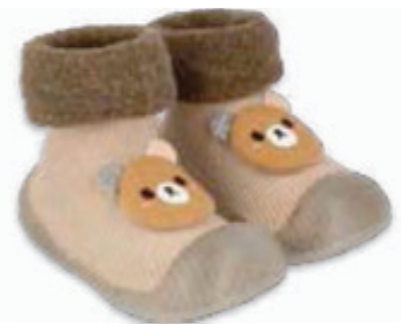
016 002P033 NIECHODKI 18, 20, 22