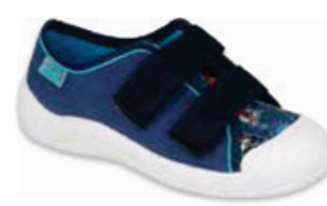
138 672X074 TIM 25-30