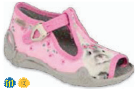
085 213P130 PAPI 18-25