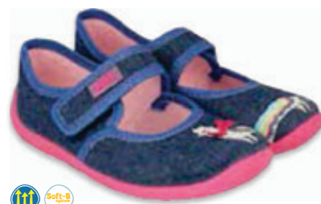
130 955X014 MELLY 25-30