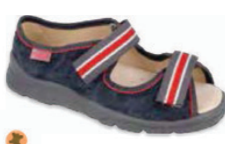
109 869Y156 MAX 31-33