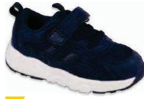
185 516P125 FIRE 20-24