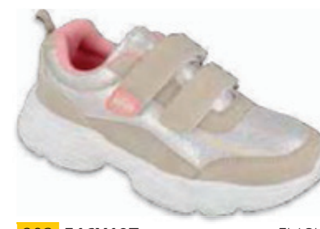
203 516X107 FLASH 25-26