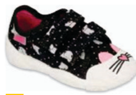
052 907P151 MAXI 18-26