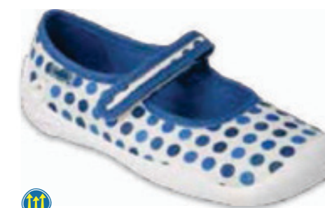
122 114Y495 BLANCA 31-36

SKÓRZANA WKŁADKA / LEATHER INSOLE / KOŻENA VLOŽKA