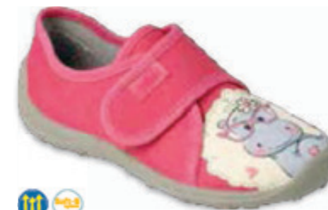
112 660X015 BOOGY 25-30