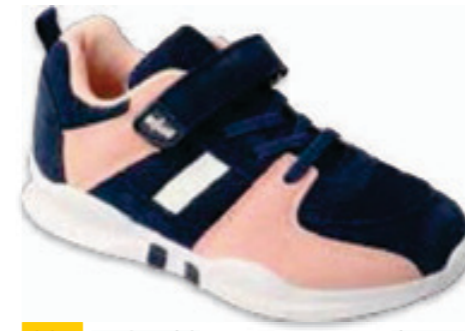
205 516X128 STRIPE 25-30