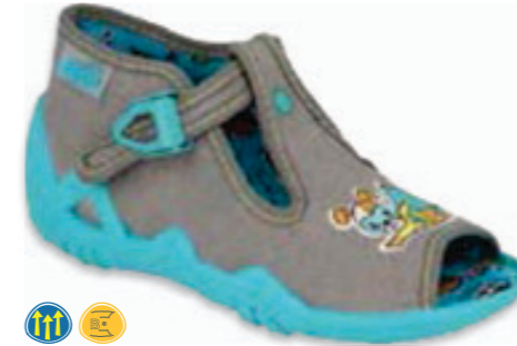
096 217P113 SNAKE 19-26